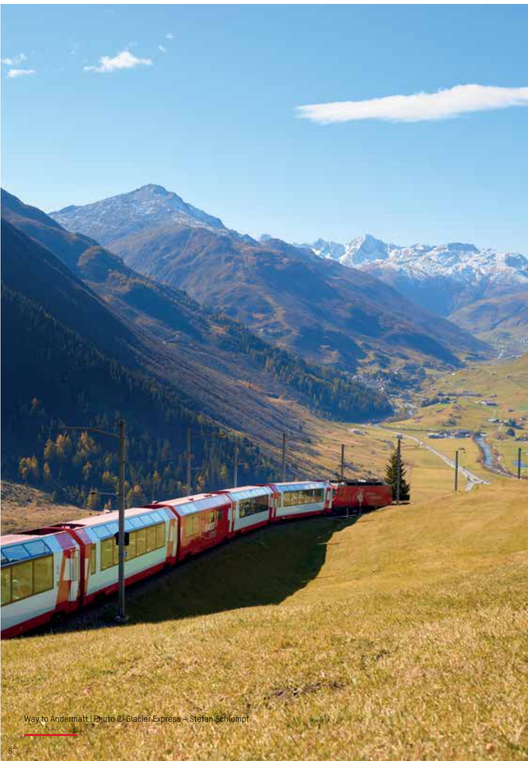
Way to Andermatt