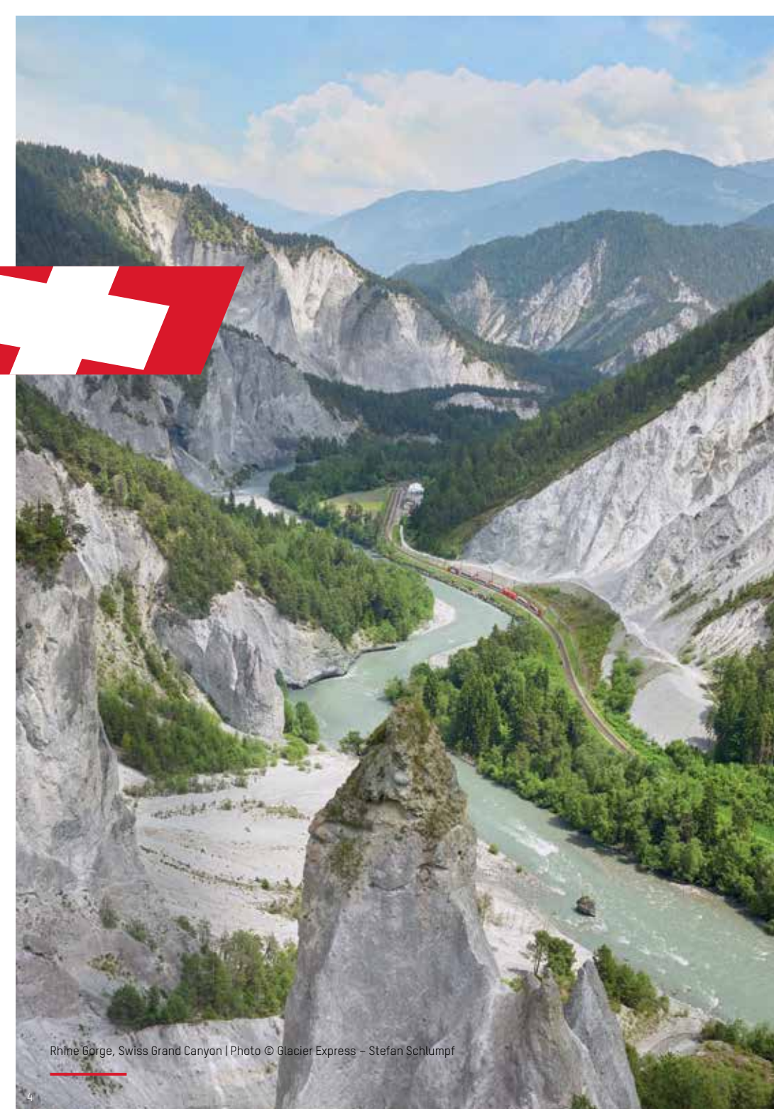
Rhine Gorge, Swiss Grand Canyon