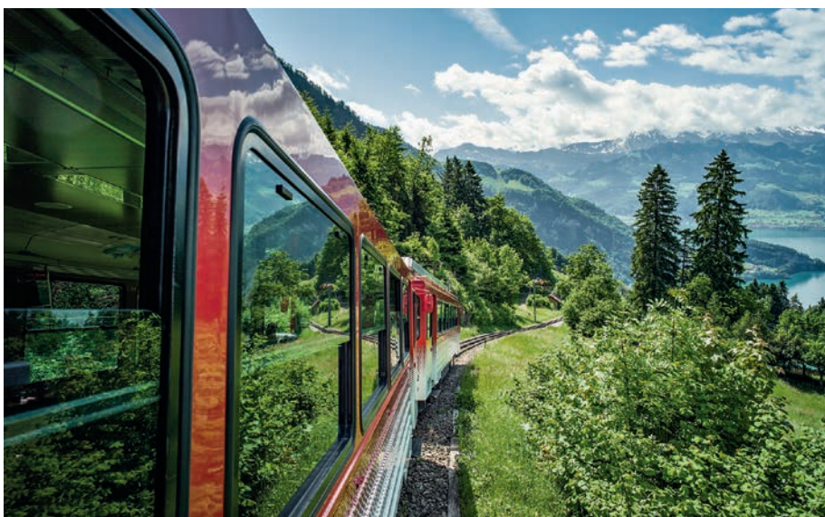
Rigi Bahn im Sommer, Rigi, Zentralschweiz