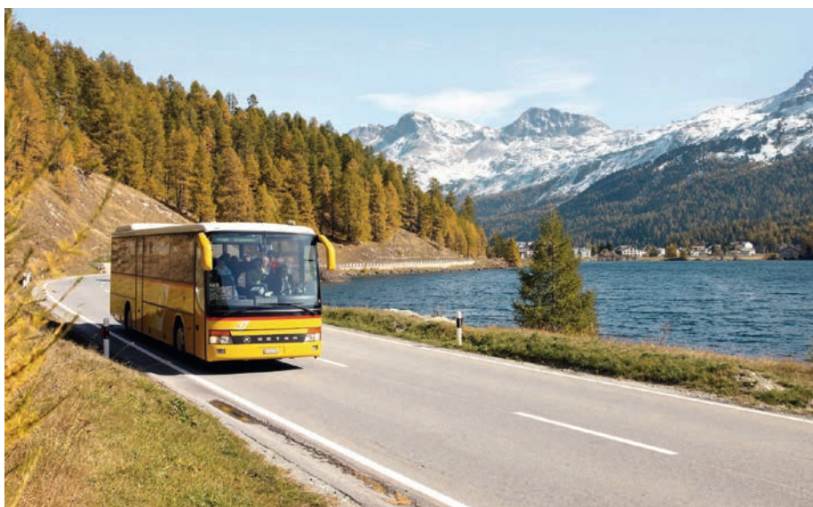
Palm Express am Silsensee, Oberengadin, Graubünden