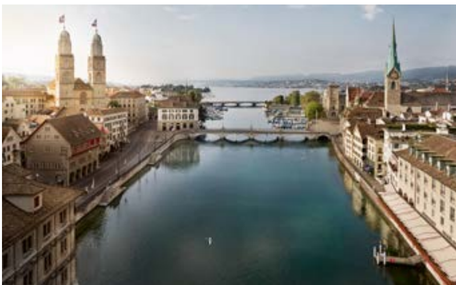
Das Grossmünster und die Limmat, Zürich