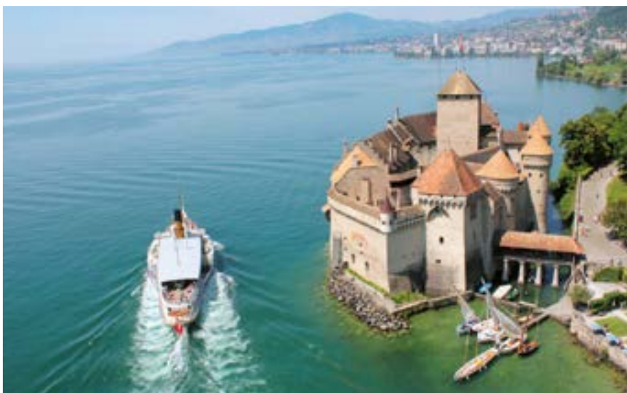
Dampfschiff fährt neben dem Schloss Chillon vorbei, Vevytau, Genferseeregion

Preise gültig 2023. Änderungen vorbehalten.