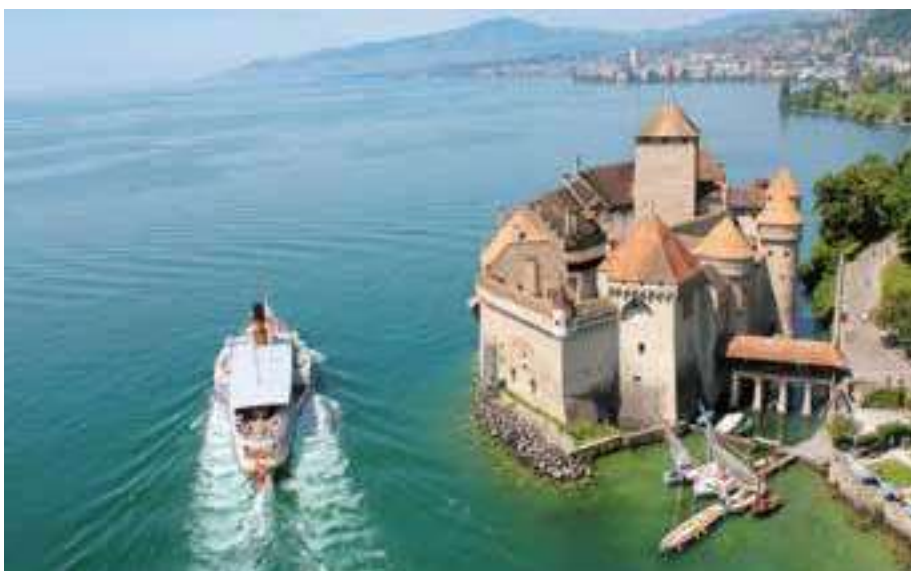
Dampfschiff fährt neben dem Schloss Chillon vorbei, Vevytau, Genferseeregion

Preise gültig 2022. Änderungen vorbehalten.