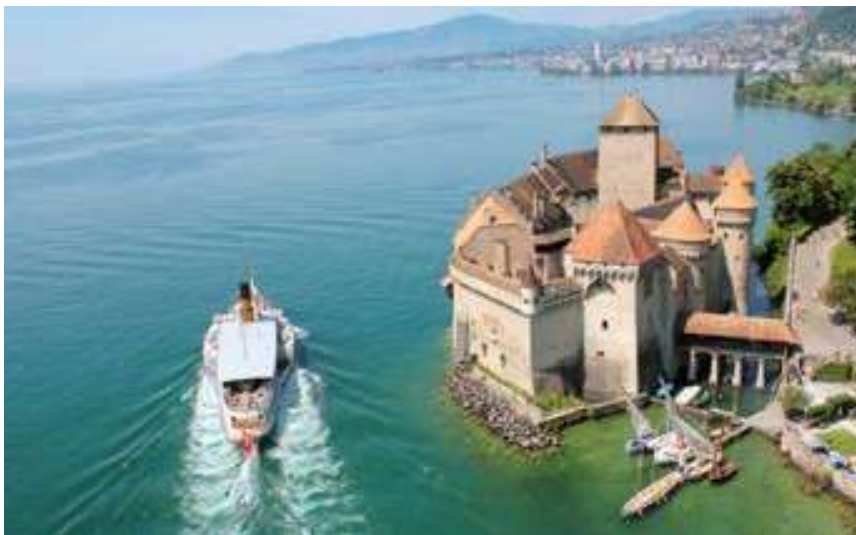
Dampfschiff fährt neben dem Schloss Chillon vorbei, Veytaux, Genferseeregion

Preise gültig 2021. Änderungen vorbehalten.