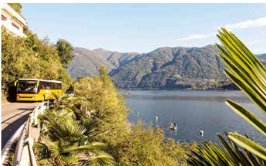
Palm Express am Comersee, Italien

mystsnet.com/palmexpress postauto.ch/palm-express